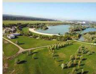
Base de loisir de Mousseaux (78)

Dans un cadre propice à la détente et aux jeux. Super ambiance avec des temps spirituels animés par :